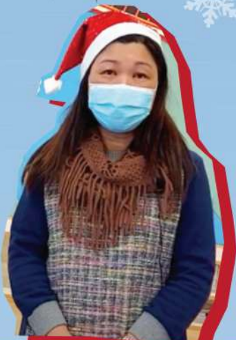
劉校牧及謝主任主持 聖誕節崇拜活動