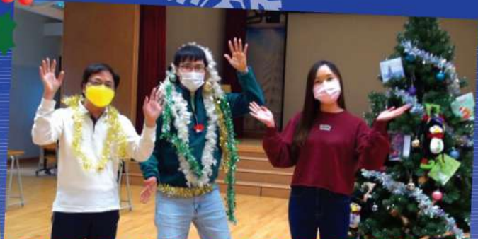
老師們以英語話劇帶出聖誕訊息