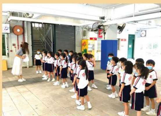
專心聆聽老師的介紹