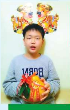
透過「心意速遞」活動，為大家送上串串祝福。